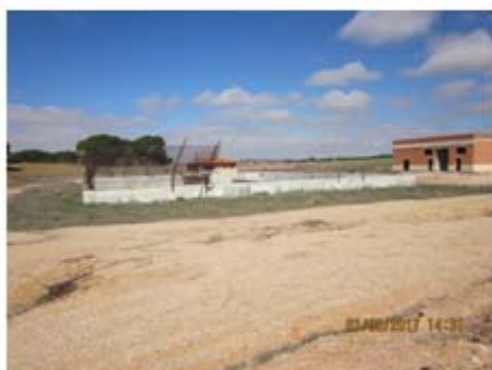
F-02 Tanque Biocos