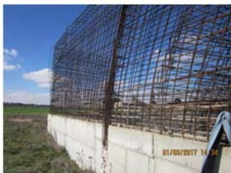
F-04 Tanque Biocos. Armaduras 2ª fase alzados