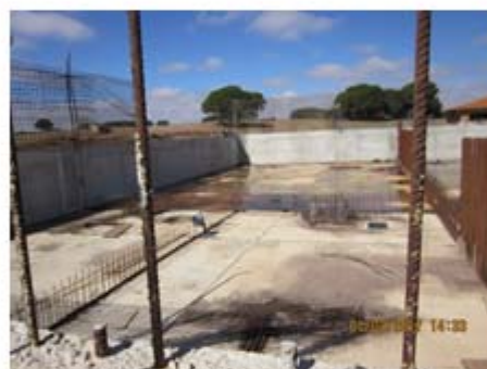
F-03 Tanque Biocos: losa 100% y alzados 50 %