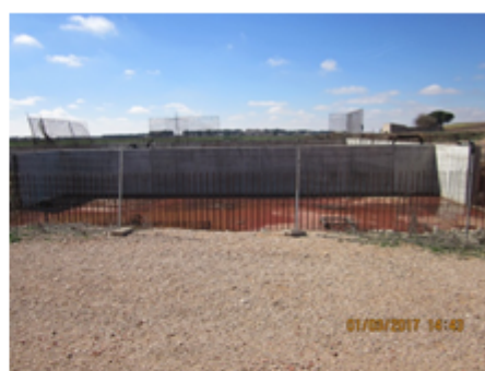
F-07 Tanque Tormentas: losa 100 %