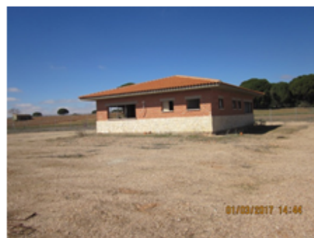
F-11 Edificio de control