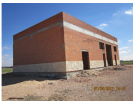
F-08 Edificio industrial