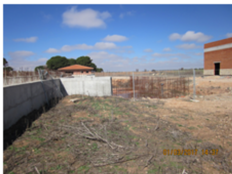
F-06 Tanque Tormentas