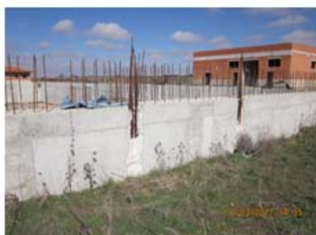
F-05 Tanque Biocos. Armaduras solape