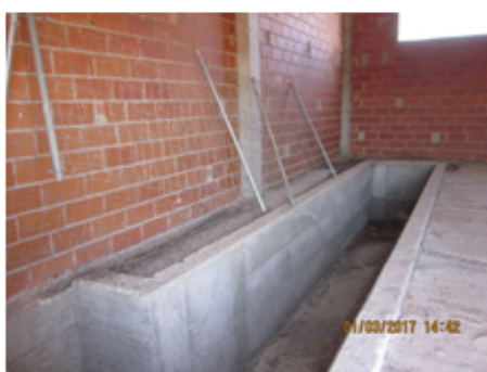
F-10 Aspiración y caja amortiguador