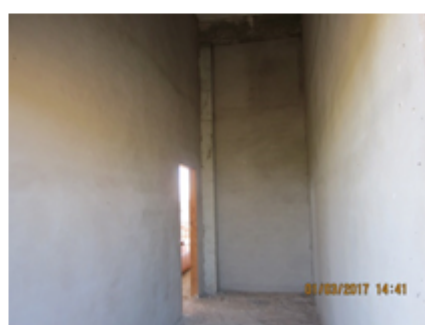
F-09 Edificio industrial: guarnecido