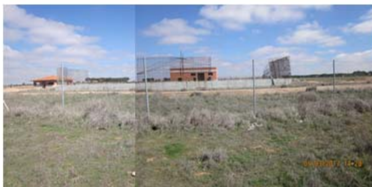
F-01 Panorámica EDAR